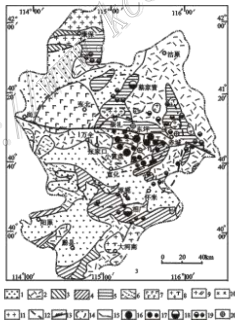
图 1 张宣幔枝构造区金银多金属矿分布简图

而在外围中上元古界拆离滑脱岩系及其上叠侏罗纪断陷盆地中则先后发现了相广银矿、万全寺银矿、梁家沟银矿、彭家沟银矿、青羊沟铅锌矿、蔡家营铅锌矿等一系列大中型银多金属矿床及几十处小型银矿床(点), 构成了外围银多金属成矿集中区(图 1)。