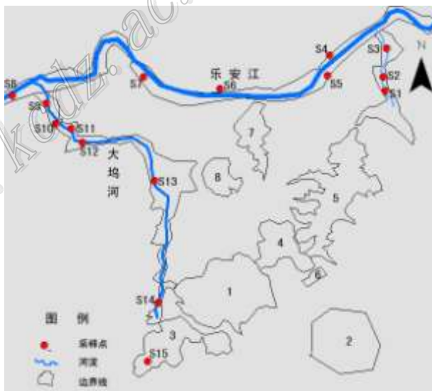
图1 江西德兴矿区概况及采样点分布

由于野外条件限制, 植被叶片的波谱测试采用的方法是将植被叶片摘下后铺在黑布上测量, 波谱测试采用美国分析光谱设备公司(ASD)生产的FieldSpecFR便携式分光辐射光谱仪(其测量波段范围为350~2400 nm, 光谱分辨率为1 nm),